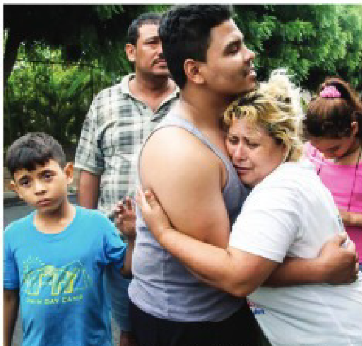
En mor kramar om sin son utanför ett av Nicaraguas barrikaderade universitet efter att ha varit frivillig i en månads tid.

– Vi måste alla dra vårt stråk till ströken. Till det arbetslösa druppen stöter, säger Nicaraguas kardinal Leopoldo Brenes till DN.