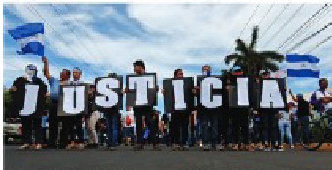
Invånare protesterar mot Daniel Ortogas regering i Managua, bärande på bakfåvor som bilda ordet "Justicia" - "Rättvisa".