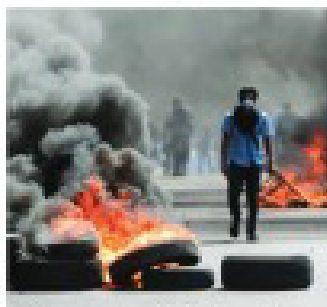
En demonstrant under de våilda protesterna i Managua i april.